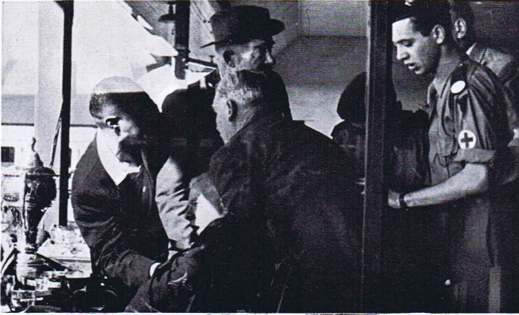
Der südafrikanische Ministerpräsident Hendrick Frensch Verwoerd nach dem ersten Attentat (zu: Mord als Mittel der Politik, S. 86)